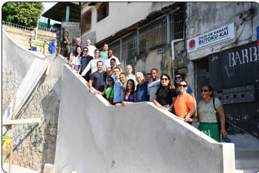
Obras de reforma da Escadaria Benedito Siqueira

A cidade de Vitória conta com 612 escadarias, que totalizam 54 mil metros lineares deste equipamento público, fundamental para a mobilidade de dezenas de milhares de moradores da cidade. Pela primeira vez nas últimas décadas, a PMV contratou a reforma e reconstrução de todas as escadarias com deficiência na acessibilidade ou danos nas estruturas.